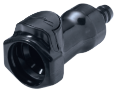
In-Line Schlauchtülle, gerade