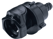
Schottverschraubung Schlauchtülle, gerade