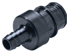
In-Line Schlauchtülle, gerade