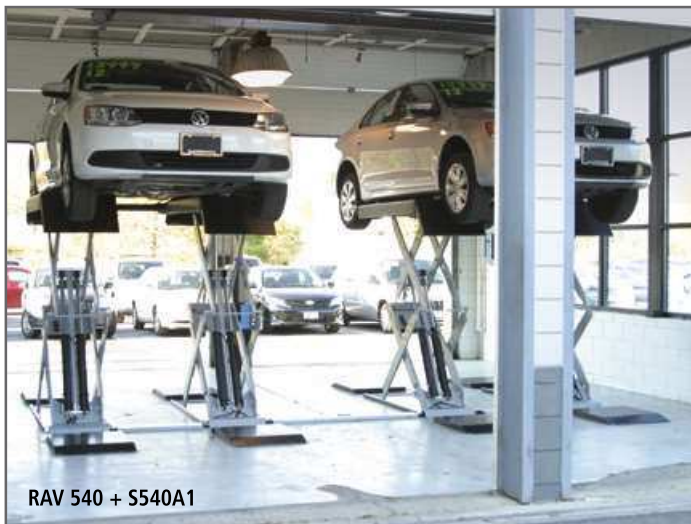
RAV 540 + S540A1

Versión de alta capacidad con plataformas más largas.