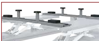
S 505 A2 (2 x kit)