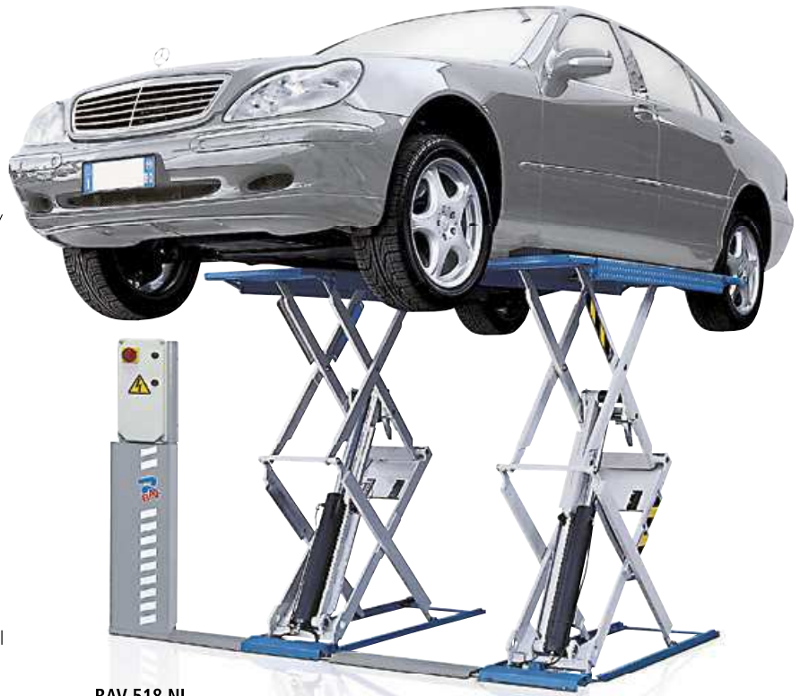
RAV 518 NL

La altura mínima del suelo facilita el acceso y permite encontrar la mejor posición para el levantamiento del vehículo. El limitado espacio que ocupa, tanto de largo cuanto de ancho, deja libre la zona cerca del elevador, aumentando la seguridad en la zona de trabajo. Ideal para reparaciones mecánicas, servicio neumáticos y amortiguadores, es una óptima elección en zona de recepción del vehículo.